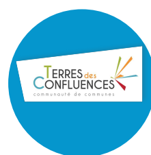
Communauté de communes Terres des Confluences