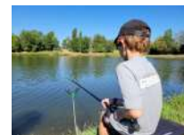
©AAPPMA Association Agréée de Pêche &amp; de Protection du Milieu Aquatique