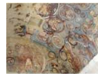
Cloître de Moissac