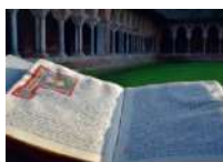
© Abbaye de Moissac - Cloître de Moissac