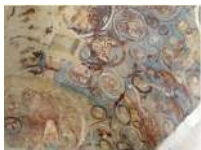
@Abbaye de Moissac - Cloître de Moissac