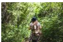
@OT Moissac Terres des confluences