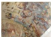
Cloître de Moissac