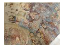
@Abbaye de Moissac - Cloître de Moissac