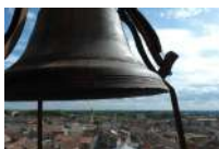
@Vie de Moissac